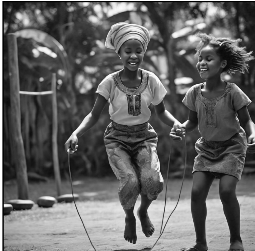
[Mothopo: Meta A/]