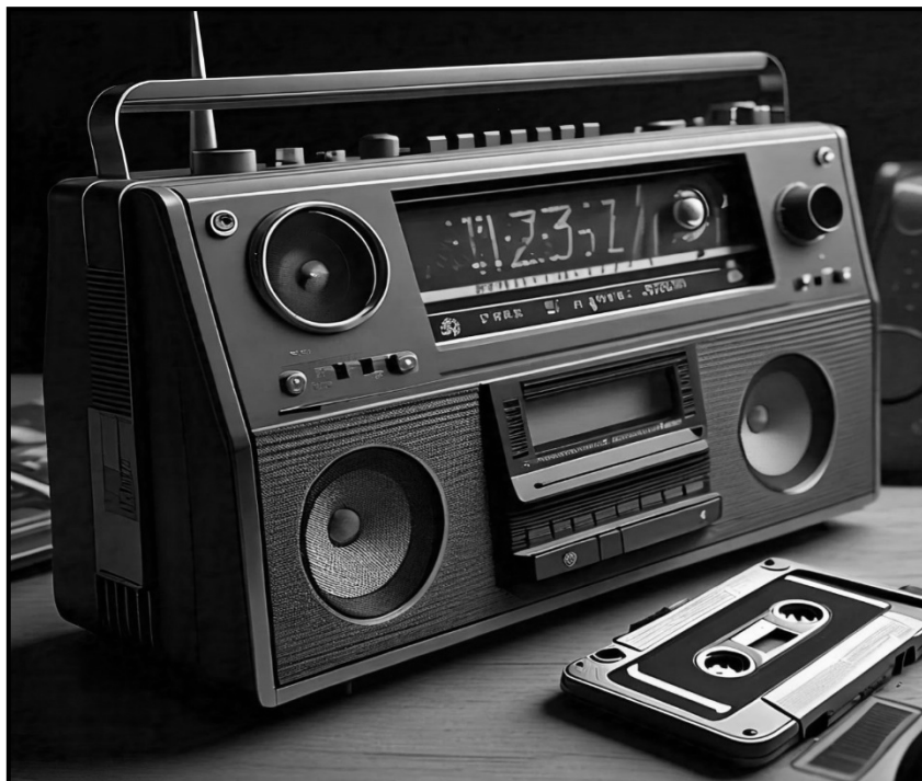
[Mothopo: Meta AI]