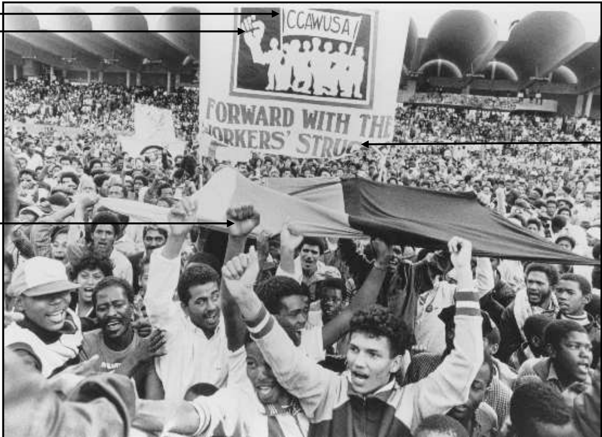
[Uit History of Trade Unionism in South Africa deur L. Gentle, et al.]

Die foto hieronder is geneem gedurende 'n byeenkoms wat op 1 Mei 1986 in die Wes-Kaap deur die Congress of South African Trade Unions (COSATU) gehou is. Dit toon werkers wat deelneem aan 'n protesaksie onder die banier van die Commercial, Catering and Allied Workers Union of South Africa (CCAWUSA), wat 'n geaffilieerde van COSATU was.