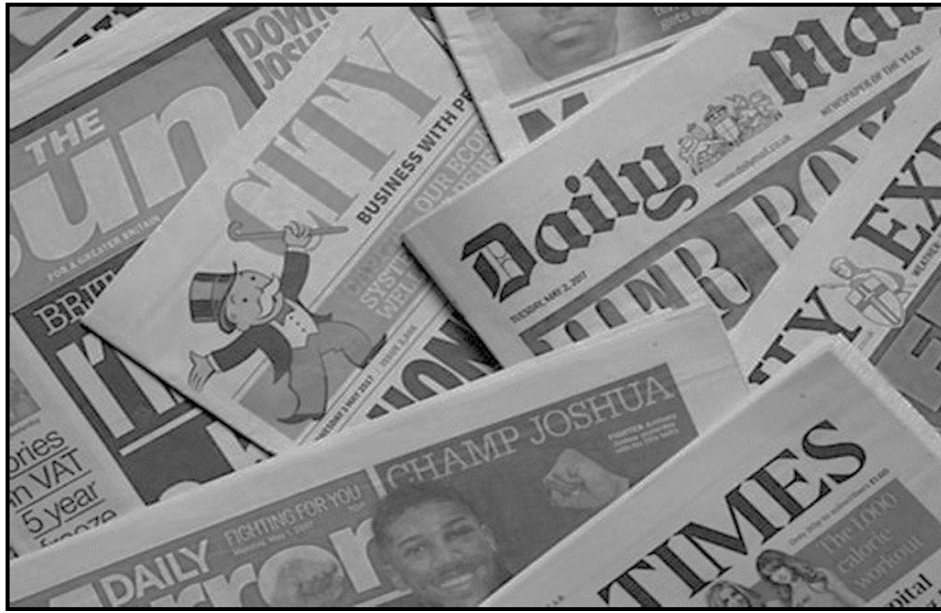
[Xi huma eka www.google.com ]